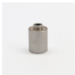
893 - Espaçador da Mola Código: 616144