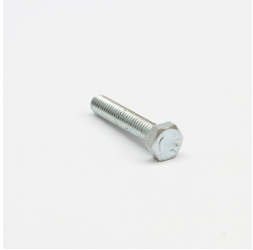
295 - Parafuso Sext. 5/16" x 1.3/4" UNC RT ZB 5.8 Código: 910083