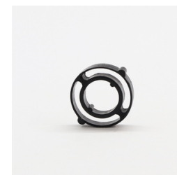
580 - Trava do Comando VAR Código: 011031