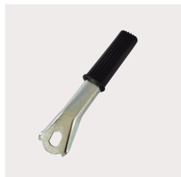
601 - Alavanca Central VAR Código: 010587