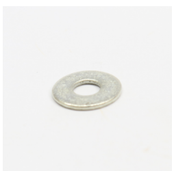
1012 - Arruela Lisa 3/8" ZB Código: 422436