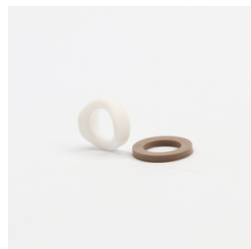
682 - Assento e Anel de Vedação