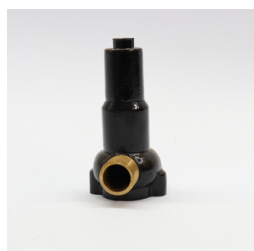
191 - Corpo da Válvula 3 Vias VAR Código: 010603