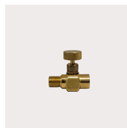
407 - Registro do Manômetro 1/4" BSP