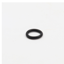
1005 - Anel de Vedação (ORI-112) Código: 416131