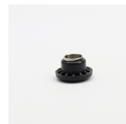
240 - Sede da Válvula do VAR Código: 010710