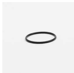
589 - Anel de Vedação (ORI-130) Código: 106948