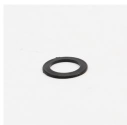
594 - Arruela de Encosto do Núcleo Ø24mm Código: 010769