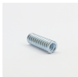
611 - Mola do Comando VAR ZB Código: 622712