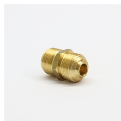
631 - Niple Latão Ø3/4" Código: 823435/010819