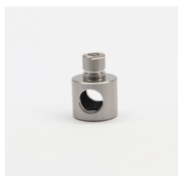
222 - Núcleo VAR (Maior) Código: 717835