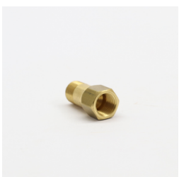
409 - Suplementa do Manômetro Código: 014423