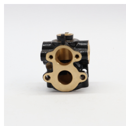
568 - Corpo do Comando VAR Código: 010546