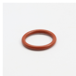
613 - Anel de Vedação (ORI-213) Código: 011601