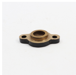
569 - Tampa do Comando VAR Código: 111203