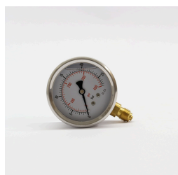
1680 - Manômetro com Glicerina 400 PSI Código: 236511