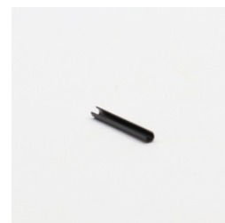
423 - Pino Elástico 3mm x 30mm Código: 917369