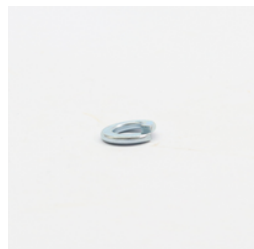
294 - Arruela Pressão 5/16 Pesada ZB Código: 908640