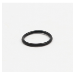
596 - Anel de Vedação (ORI-119) Código: 012724