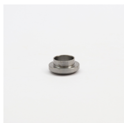
597 - Calço Ø29 x 12,5 Inox Código: 010793