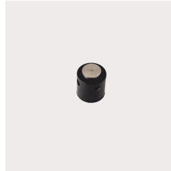
250 - Válvula com Inserto VAR Código: 010728