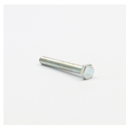
300 - Parafuso Sext. 5/16" x 2.1/2" UNC RT ZB 5.8 Código: 627992