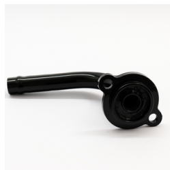
950 - Bico p/ MG. 3/4" c/ Flange Código: 339952