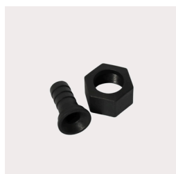
408 - Bico Mangueira 1/2" com Porca 3/4" Código: 110619