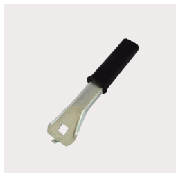
595 - Alavanca Lateral VAR Código: 010561