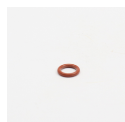
618 - Anel de Vedação (ORI-111) Código: 011676