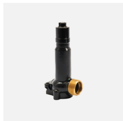
814 - Cilindro VAR 4 Vias