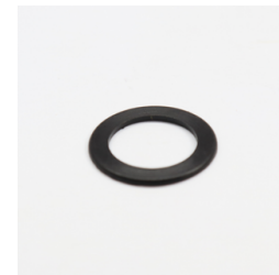
590 - Apoio de Núcleo Ø30mm (MAIOR) Código: 010645