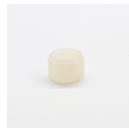
593 - Calço Ø29 x 19,5mm Código: 010801