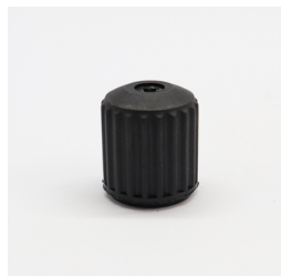
257 - Volante do Comando Código: 010629