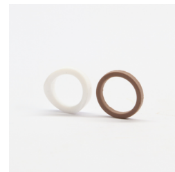
592 - Assento e Anel de Vedação VAR Código: 110593