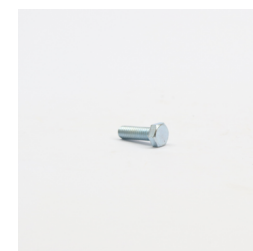
284 - Parafuso Sext. 5/16 x 1 UNC ZB 5.8 RT Código: 917419