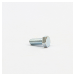
293 - Parafuso Sext. 5/16" x 3/4" UNC ZB 5.8