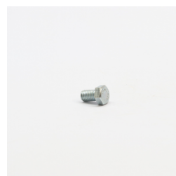
290 - Parafuso Sext. 3/8" x 5/8" UNC RT ZB 5.8 Código: 917682