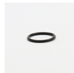
614 - Anel de Vedação (ORI-219) Código: 011593