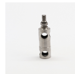
223 - Núcleo VAR (2 Vias) Código: 206227