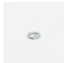
289 - Arruela Pressão 3/8" Pesada ZB Código: 908566