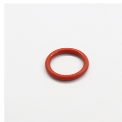
617 - Anel de Vedação Silicone (ORI-114) Código: 706796