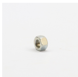
305 - Porca Sext. 3/8" UNC ZB 5.8 Código: 912774