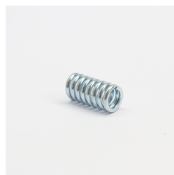
673 - Mola Ø18 x 34mm ZB Código: 616151