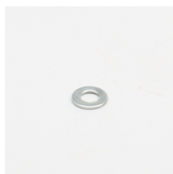
858 - Arruela Lisa M8 Zb Código: 013433