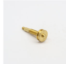
862 - Parafuso Reg. VAR 4 Vias Código: 117960 / 020065